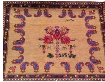
شکل ۶. مخده با طرح تک خشت سه لندتی و بته جقه (در چالشر به گل رز یا گل فرنگ، گل لندتی گفته می‌شود)، منبع: تاجی، آرشیو عکس شخصی: ۱۳۹۸.

کاربرد دیگر قالی‌های تزئینی خوشامدگویی به بزرگان بوده است. آقای شیرزاد از مطلعین محلی می‌گوید: در زمان حکومت خوانین، قبل از ورود حکام و بزرگان سایر مناطق به چالشر در ورودی‌های این روستا یا قلعه، قالی‌هایی پهن می‌کردند و قدوم این بزرگان را با قالی حتی به طول یک کیلومتر مزین می‌کرده‌اند (شیرزاد، گفتگوی حضوری: ۱۳۹۴).