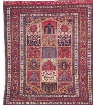
شکل ۲. قالی بی‌باف خشتی محرابی کتیبه دار، ابعاد پرده‌ای، منبع: بایگانی عکس اتحادیه تعاونی‌های فرش دستباف روستایی استان چهارمحال و بختیاری، ۱۳۸۶.

با توجه به موارد ذکر شده می‌توان چنین در نظر گرفت که منظور از قالی بی‌باف قالی‌هایی با کیفیت بسیار بالایی بودند که با سرمایه خوانین و نظارت بی‌بی‌ها با بهترین مواد اولیه (پشم دست ریس، رنگرزی کاملاً طبیعی و باثبات)، استفاده از شیوهٔ تب‌کو ۱ و بهترین بافنده‌ها تولید می‌شدند. این قالی‌ها توسط بافندگان گمنامی بافته می‌شد که از این رهگذر تنها مشقت و تحمل سختی‌ها با اندکی دستمزد به آنان تعلق می‌گرفت. به طوری که اکنون بعد از گذشت سال‌های متمادی نامی از بافنده‌ها برده نمی‌شود، بلکه این قبیل قالی‌ها فقط به نام بی‌بی‌باف شهرت پیدا کرده‌اند؛ در حالی که بی‌بی‌ها هرگز خودشان قالی نمی‌بافتند. بافندگان کارگاه‌های قالی‌بافی بی‌بی‌ها این نوع قالی‌ها را با تحمل مرارت‌های فراوان می‌بافتند که دستمزدشان اغلب تب ۲ به تب ۳ و در پایان روز توسط بی‌بی‌ها یا پاکارهای آن‌ها حساب می‌شد (بهرامی و نصراللهی، گفتگوی حضوری: ۱۳۹۳). بی‌بی‌ها به هیچ‌وجه اجازهٔ کپی‌برداری از روی نقشه‌هایشان را نمی‌دادند. پیرزنی که عمر خود را در کارگاه بی‌بی به بافندگی گذرانده، از آن زمان چنین یادکرد: من یکی از شاگردان کارگاه بی‌بی بودم، از