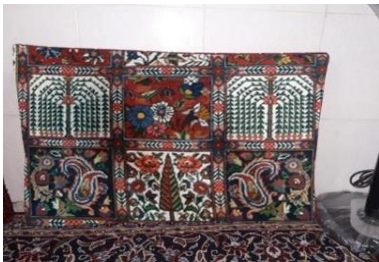
شکل ۵. مخده با طرح خشتی، منبع: نگارنده، تحقیقات میدانی، ۱۳۹۷.

قالی‌هایی با کاربرد تزئینی، در زمان‌های ویژه‌ای همچون مراسم‌هایی که در منطقه و در زمان‌های خاصی وجود دارد، به‌طور موقت تغییر کارکرد می‌دهند. یکی از این زمان‌های ویژه هنگام برگزاری مراسم عروسی و روز «داماد سلام» است. در منطقه چالشر همانند برخی دیگر نقاط کشور، روز بعد از عروسی «پاتختی» گفته می‌شود و روز بعد از آن «داماد سلام» است که خانواده عروس، داماد و فامیل نزدیک ایشان را به منزل خود مهمان می‌کنند. در این شب تختی بسته می‌شود که پشت این تخت برای تزئین از قالی استفاده می‌کنند و پای تخت در جلوی عروس و داماد به شادی و پای‌کوبی می‌پردازند و هدایایی به عروس و داماد داده می‌شود.