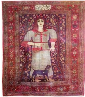
شکل ۳. قالی بی‌باف زن ایستاده به همراه سگش، اندازه ۶ متری، ۱۳۲۴ ه.ق