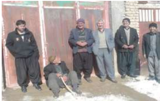
تصویر ۷: حوزه عمومی در آسیاو و اهالی روستای زئورام

معنادهی به مکان سبب آشنایی با قلمرو و خوانایی آن می‌شود؛ بنابراین شدت روابط اجتماعی، شکل‌گیری هویت جمعی و تاریخ مشترک در درون خانه، منطقه مسکونی و تمام قلمرو روستا باعث شده که روستاهای کاکاوند به «مکان‌های انسان‌شناختی» تبدیل کرده شوند.