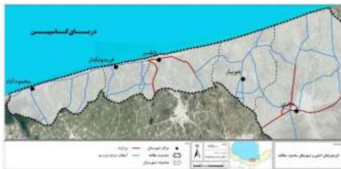
تصویر ۱: موقعیت مکانی محدوده مورد مطالعه

ناحیه مورد مطالعه در این پژوهش پنج شهرستان ساحلی ساری، جویبار، بابلسر، فریدون‌کنار و محمودآباد، در استان مازندران را شامل می‌شود که به ترتیب ۲۱/۸، ۱۵/۵، ۲۷، ۸ و ۸ کیلومتر نوار ساحلی دارند. نواحی پیراشهری شامل زمین‌های واقع در محدوده حریم شهرها، نواحی روستایی و زمین‌های خارج از محدوده قانونی روستا و حریم شهرها می‌شود. سه عنصر کالبدی اصلی در این محدوده نقش ایفا می‌کنند که شامل کریدور شرق به غرب، سکونتگاه‌های واقع در جنوب کریدور و اجتماعات دروازه‌ای در شمال کریدور هستند. در این پژوهش، فضاهای انحصاری در قالب اجتماعات دروازه‌ای هم در جنوب و هم در شمال کریدور نام برده مدنظر است (تصویر ۱).