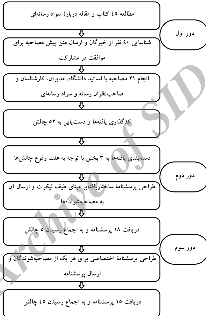
شکل ۲- فرآیند پژوهش در یک نگاه

پس از اتمام دور اول با هدف اکتشاف چالش‌های افزایش سواد رسانه‌ای مخاطبان برای سازمان صداوسیما از طریق مصاحبه عمیق، دور دوم و سوم با هدف اجماع بر سر یافته‌های دور