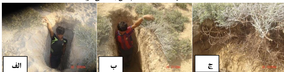
شکل ۳: الف، وجود ریشه‌های نمدی منظور استفاده از شبنم (شرجی)، ب و ج، حفر پروفیل خاک به منظور مطالعه ریشه دوانی گونه ساحلی

Subset for alpha = 0.05 (عمق به سانتی‌متر)