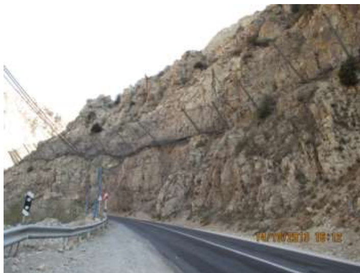
شکل ۳: سنگ‌های شکسته بر روی دامنه‌های فعال و سازه‌های محافظتی ژئوتکنستالی (مکان جاده شمشک به تهران در محدوده حوضه آبریز).