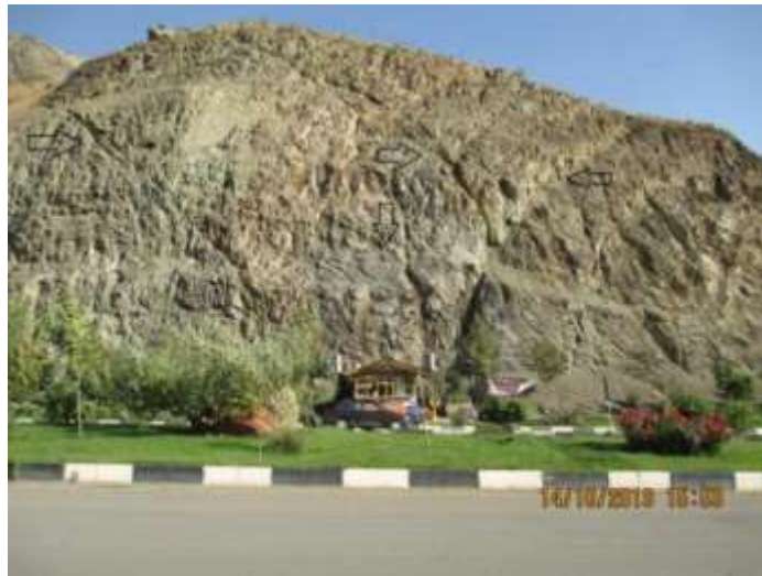
شکل ۴: وجود آثار سیستم های گسلی در منطقه که تأثیر پذیری سطح حوضه را از عوامل تکتونیکی نشان می دهد (مکان جاده اوشان به تهران در محدوده حوضه مورد بررسی).