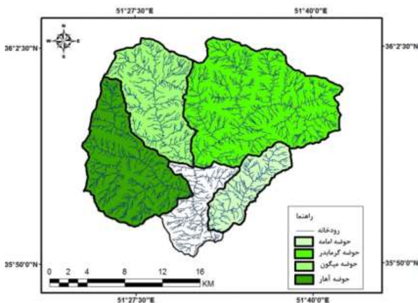
شکل ۵: زیرحوضه های حوضه آبریز رودک به ترتیب از راست پایین به چپ امامه، گرمابدر، میگون و آهار