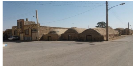
شکل ۲: نمایی از دو واحد مسکونی همجوار (استحکام خانه‌های زمان حاضر و مصالح مقاوم)

«... بنیاد مسکن وام ساخت می‌دهد بر مرحله به مرحله ساخت خانه طبق قانون و مقررات نظارت می‌کند ...»