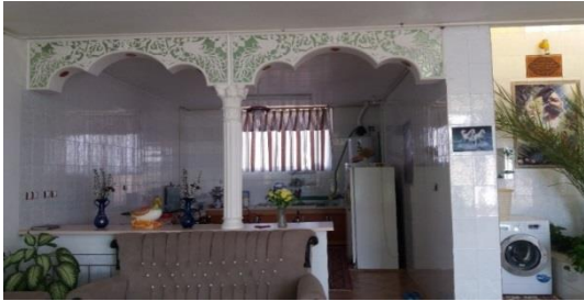
شکل ۱: نمایی از فضای درونی یک خانه روستایی (آشپزخانه این و مبل)

نزدیک‌تر باشد به همان میزان نیز نفوذ عناصر و فرهنگ شهر در روستا نیز بیشتر می‌شود.