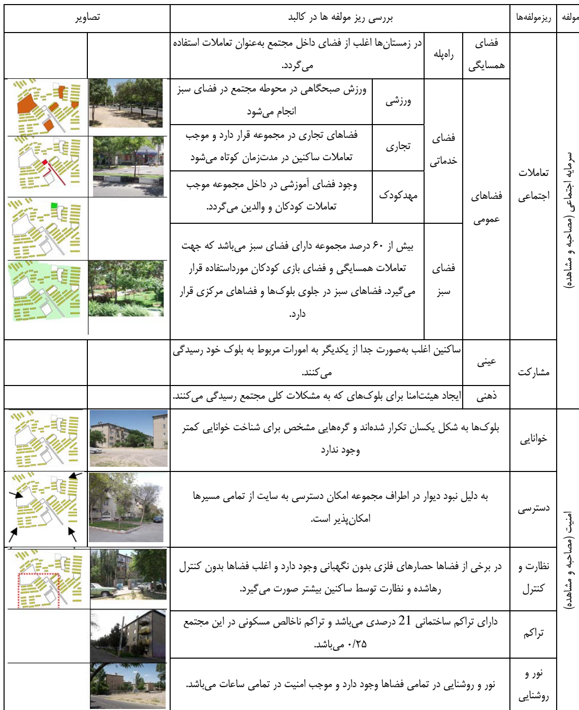
جدول ۶. بررسی مولفه‌های اجتماعی در مجتمع چمران

بلوک‌هایشان جهت تعاملات همسایگی استفاده می‌کنند. نگرهبانی برگزار می‌شود و ساکنین کمتری در آن حضور تعاملات همسایگی اغلب در تابستان در محوطه و در زمستان در راه پله و راه روها صورت می‌گیرد. فضای مدیریتی در طراحی مجتمع در نظر گرفته نشده و جلسات مشارکت در محوطه حضور دارند، صورت می‌گیرد.