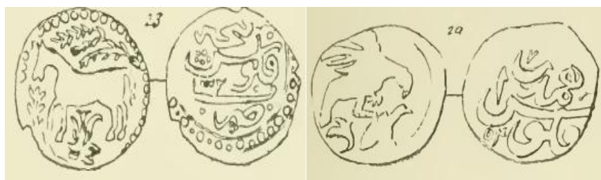
تصویر اسب (۱۰)