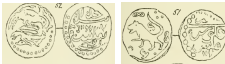
تصویر پرنده (۷)

بررسی‌های صورت گرفته نشان می‌دهد که در اواخر دوره صفوی، سکه‌های مسی و نقوش حیوانی به وفور بر روی سکه‌ها حک می‌شد. این شیوه پس از سقوط دولت صفوی و دوره نایب‌السلطنگی نادر نیز رایج بود. پس از سقوط افشاریه نیز همان نقوش حیوانی به تعداد زیاد در دوره زندیه قابل مشاهده است. شاید علت کمبود مسکوکات مسی (فلوس) در آن دوره نتیجه سیاست تمرکز قدرت دولت نادری بوده است (موسوی دالینی، «تحلیلی بر کنش‌های اقتصادی فرمانروایان ایرانی و پیوند آن با قدرت و امنیت»، ۱۸۹-۱۹۰). برخی از نقوش حیوانی بر روی سکه‌های دوره افشاریه عبارتند از: شیر در حال شکار غزال، به تاریخ ۱۱۴۵ (علاءالدینی، ۹۴)، شیر و خورشید، تصویر خورشید (ترابی، ۲۶۸-۲۶۹)، تصویر پرنده، تصویر شیر، تصویر گوزن، تصویر اسب و تصویر عقاب در حال شکار (Valentine, 103, 119, 133).