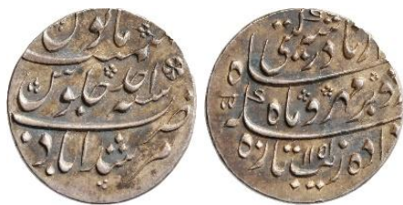
تصویر ش ۴

گرچه این بیت توسط شعرای فارسی‌زبان وارد دارالضرب‌های هندوستان شده، اما پیش از گورکانیان در سکه‌های ایرانی استفاده نشده بود و در دوره نادر و شاه‌رخ متأثر از ارتباط با هندوستان، بر روی سکه‌های دوره افشاری مورد استفاده قرار گرفته‌است. نوشتار سکه‌های ایالت‌های هندوستان با حضور نادر تغییر پیدا کرد و ضرابخانه‌های این کشور به نام نادر سکه ضرب کردند. نادر تاج پادشاهی را به دست خویش بر سر محمدشاه قرار داد و محمدشاه نیز پس از قلدردانی از نادر، عهدنامه‌ای در خصوص اطاعت و انقیاد و متابعت خویش نوشت و در آن، از سرحد لاهور تا کابل را به رسم پیشکشی به نادر داد. سپس نادر در سال ۱۱۵۲ از شاه جهان‌آباد به قصد تسخیر ممالک سند راهی شد (مروی، ۲/ ۷۵۱ و ۷۵۲؛ حدیث نادرشاهی، ۳۴). این وضعیت با وجود بازگشت نادر به ایران تا سال ۱۱۶۰ یعنی ۹ سال پس از تهاجم نادر به هند ادامه داشت. بر روی تعدادی از سکه‌های دوره نادر با خط نستعلیق نوشتاری به این مضمون وجود دارد: «از خراسان سکه بر زر شد به توفیق خدا» (ترابی، ۲۶۰) که در دوره پادشاهان صفوی نیز استفاده شده بود (Gold ashrafi of Nadir Shah). همین عبارت ظاهراً پیش از استفاده شاهان صفوی، در ضرابخانه محمدشاه گورکانی بدین صورت نقر شده بود: «سکه زد در جهان بلطف اله - پادشاه زمان محمد شاه» (Whitehead, 332).