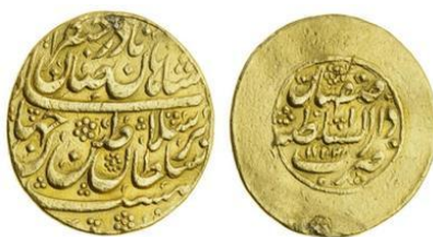
پشت و روی سکه ضرب شده در ضربخانه تبریز (دوره صفویه)

ضرابخانه‌های دوره صفوی دارای علامت خاص خود بودند که اغلب بر یک طرف سکه حک می‌شد. بیش از ۱۵ مورد این علائم شناسایی شده‌است (نک. ثواقب و همکاران، ۹۰-۹۱). سکه‌های دوره افشار دارای نشان و علامت خاصی مانند دوره صفوی نیستند. گرچه جمله «الخیر فیما وقع» (تصویر ش ۱۹) که به حروف ابجد مصادف با آغاز سلطنت نادرشاه است، به خط طغری، یکی از مشخصه‌های بارز روی سکه‌های نادرشاه است (مروی، ۲/ ۴۵۷؛ شمس اشراق، ۲۰). همچنین تحریر نام «السلطان نادر» بر روی مسکوکات نادر و حتی جانشینان او با انشاء متفاوت، نشان تنوع مسکوکات و فعالیت ضربخانه این دوره است. بنابراین، در عین این‌که نام «السلطان نادر» بر روی سکه‌ها در یک نگاه مشابهت زیادی را در ذهن ایجاد می‌کند، اما شیوه نگارش و تزیینات پس‌زمینه آن‌ها، به هرکدام از آنها هویت جداگانه‌ی داده است (جدول ش ۱).