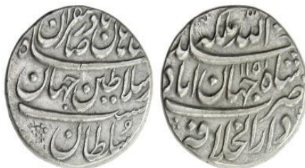
پشت و روی سکه ضرب شده در ضربخانه اصفهان (دوره افشاریه)