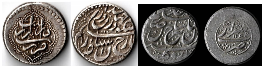
تصویر ۱۲ و ۱۳. https://www.zeno.ru/showphoto.php?photo=119067&115405

نقوش هندسی نیز اغلب بر روی سکه‌های مسی استفاده می‌شد، از این‌رو فراوانی بیشتری داشته است. بیشتر خطوط رایج روی سکه‌های نادری به شکل دایره با خطوط ممتد و نقطه‌چین است. یکی از مشخصه‌های مهم سکه‌های افشاری، دایره در پشت سکه‌ها است که اطراف آن فاقد نوشتار و تزیین است و داخل آن معمولاً نام ضربخانه و یا اسم پادشاه ذکر شده است. البته در دوره برخی حاکمان افشاری، فلوس‌هایی به شکل مربع نیز ضرب شده است (https://www.zeno.ru/showphoto.php?photo=164534). بر روی برخی فلوس‌های دوره نادر که براساس رویه ضربخانه‌های کشمیر ضرب شده، تزیینات هندسی وجود دارد و صرفاً به جای سلاطین کشمیر از «السلطان اعظم نادرشاه» و پشت آن از تزیینات هندسی رایج آن ایالت استفاده شده است (www.acsearch.info). البته سکه‌های دوره افشاریه در زمان شاهرخ، از کیفیت و تزیینات هندسی بهتری برخوردار شد (تصویر ۱۲ و ۱۳).