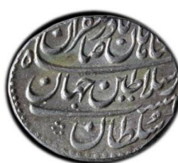
تصویر ش ۲