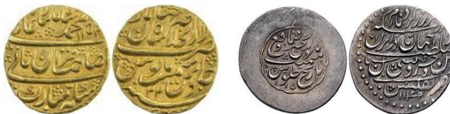
تصویر ش ۵، ۶ و ۷ www.acsearch.info/afsharid