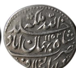
تصویر ش ۱