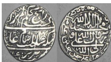
تصویر ش ۳

(Gold ashrafi of Nadir Shah). استفاده از القابی چون «خسرو گیتی‌ستان» و «شاه شاهان» نیز متأثر از رویدادهایی تاریخی بود. در دوره جانشینان نادر وضع متفاوت است. علی‌قلی خان برادرزاده نادر در بیست‌وهفتم جمادی‌الثانی ۱۱۶۰، در ارض اقدس جلوس کرد و خود را علی‌شاه و عادل‌شاه نامید و سکه به‌نام خود ضرب کرد» (استرآبادی، ۴۲۷؛ مروی، ۱۱۹۸/۳؛ سلطان هاشم میرزا، ۹۰). رویکرد شعائر در دوره عادل‌شاه برخلاف نادر بیشتر جنبه مذهبی و شیعی دارد و اغلب سکه‌های او در قالب سکه‌های دوره صفوی و دارای مشخصه‌های بارز شیعی هستند (تصویر ش ۳).