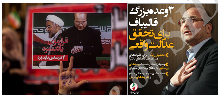
تصویر ۷- یکی از پوستر تبلیغاتی قالیباف در انتخابات ۹۶ تصویر ۸- یکی از پوسترهای تبلیغاتی قالیباف در انتخابات ۹۶ در زمینه یک عکس تبلیغات (ایسنا، ۱۳۹۶، {۲})

تحت سلطه و استثمار ۴ درصد دیگر قرار دارند (رکنا، ۱۳۹۶). وی تلاش داشت در ادامه تصویری که احمدی‌نژاد از ساده زیستی خود به‌عنوان یک هنجار مطلوب توده‌ها ارائه کرده بود، با حضور در جمع کارگران و اقشار متوسط و پایین جامعه ذیل شعار «دولت مردم» خود را برانگیخته خیر عمومی و روحانی و دولت وی را نماینده شر عمومی معرفی نماید.