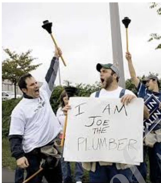
تصویر ۵- طرفداران مک کین که شبیه جو لوله‌کش لباس پوشیده‌اند (SFGATE, 2008)

بنابراین تصویر جوی لوله‌کش به‌عنوان یک نماد، معانی متغیر و متناوبی را در خلال یک رقابت انتخاباتی با خود به همراه داشت که در برساختن آن معانی، بستر فرهنگی جامعه، ظرفیت‌های رسانه‌های جمعی، فرصت‌طلبی و هوشمندی تیم‌های تبلیغاتی کاندیداها و البته خوش‌شناسی فرهنگی و میل به کنشگری جو لوله‌کش نقش داشت. از آنجاکه ورزلباخر از شهرت غیرمنتظره‌اش لذت می‌برد، فرصت‌های جدیدی برای گروه‌های سیاسی وجود داشت که با وی متحد شوند و به‌واسطه تشویق وی به سخن گفتن به‌عنوان نماینده اجتماعی آن‌ها، به وی اجازه دهند که بر شهرتش بیفزاید. در واقع، ورزلباخر به‌طور منظم در گردهمایی‌های سیاسی محافظه‌کارانه در سرتاسر کشور حضور می‌یافت و علیه مالیات و علیه اتحادیه‌های کارگری و به طرفداری از ارزش‌های خانوادگی محافظه‌کارانه موضع می‌گرفت. در همان زمان، گروه‌هایی که