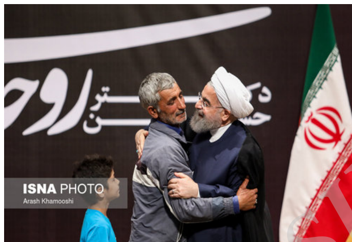
تصویر ۱۴- تقدیر حسن روحانی از میرزا آقا (ایسنا، ۱۳۹۶ {۱})