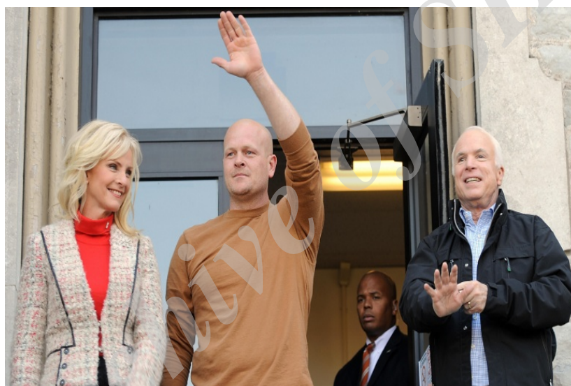
تصویر ۲- حضور مک‌کین و همسرش در کنار جو لوله‌کش در ۳۰ اکتبر ۲۰۰۸ در واشینگتن پارک در ساندینسکی اوهایو

سه روز بعد، در خلال آخرین مناظره انتخاباتی، رقیب او با «جان مک‌کین» پای «جو لوله‌کش» را در اولین ۵ دقیقه مناظره به میان کشاند و ۲۲ مرتبه به صورت مجزا در طول آن شب به وی اشاره کرد (2}{youtube(2008)}. «جو لوله‌کش» به تم کانونی جدال انتخاباتی بین دو رقیب حول مسائل اقتصادی طبقات پایین متوسط و تأثیر برنامه‌های مالیاتی روی معیشت آن‌ها بدل شد و در پاره‌گفتارهای طرفین حضور نمادین برجسته‌ای یافت.