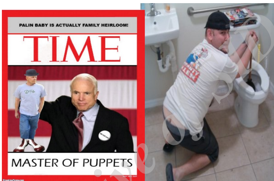
تصویر ۶- نمونه‌هایی از هجو تصویر جوی لوله‌کش توسط مخالفان مک‌کین (freakingnews, 2008)

مخالف این سیاست‌ها بودند در بسیج نمایش‌های ضد ورزلباخری مشغول بودند و متناوباً لوله‌کش‌های دیگری را به‌عنوان «لوله‌کش‌های واقعی» در مخالفت با جو ورزلباخر به سخن در می‌آوردند تا ورزلباخر و گروه‌هایی که از وی برای حضور در گردهمایی‌هایشان دعوت می‌کردند را بی‌اعتبار کرده و تمسخر نمایند.