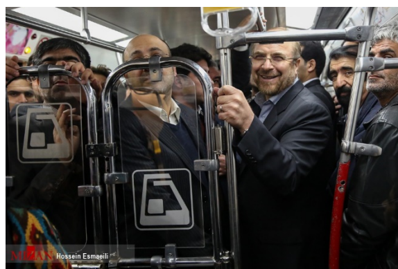
تصویر ۹- عکس تبلیغاتی حضور قالیباف در مترو شلوغ (آفتاب، ۱۳۹۵)