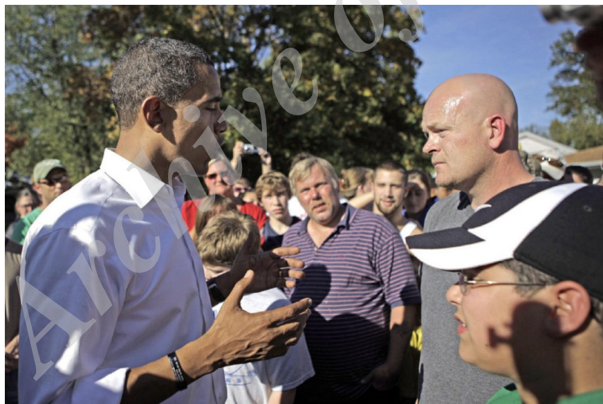
تصویر ۱- مکالمه اوباما و جو لوله‌کش در ۱۲ اکتبر ۲۰۰۸ سه روز پیش از آخرین

نزدیک به پایان رقابت انتخابات ریاست‌جمهوری ایالات متحده در سال ۲۰۰۸، کاندیدای ریاست‌جمهوری از حزب دموکرات، باراک اوباما هنگامی که مشغول یک حضور تبلیغاتی در ایالت اوهایو بود با جو ورزلباخر ۱ ، یک لوله‌کش ساده روبرو شد. ورزلباخر به اوباما گفت که قصد دارد سهم شریکش در شغل لوله‌کشی را خریداری کند و نگران است که چطور طرح مالیاتی اوباما بر وضعیت او تأثیر خواهد داشت. دو مرد مکالمه کوتاهی در خصوص مالیات‌ها و سیاست عمومی داشتند، درحالی‌که دوربین‌های خبری کل مکالمه را ضبط می‌کردند (1) (youtube, 2008). آن‌یک برخورد نسبتاً معمولی بود، حتی بسیار ساده‌تر از سایر رویدادها در تبلیغات انتخاباتی که شبیه به نمایشنامه‌هایی از پیش تنظیم‌شده هستند به نظر می‌رسید.