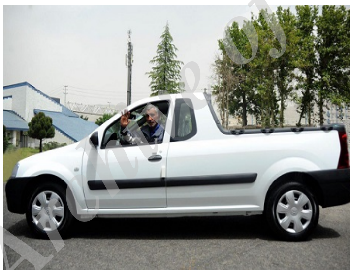
تصویر ۱۵- اهدای خودروی وانت به میرزا آقا توسط ایران خودرو (عصر ایران،