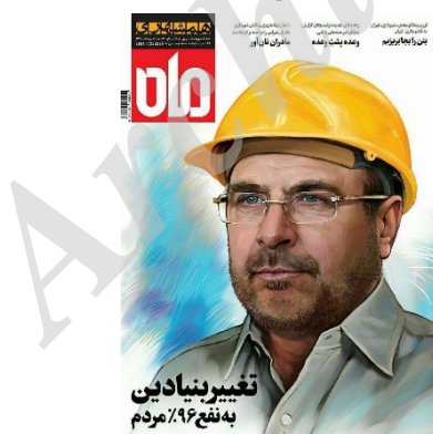
تصویر ۱۰- تبلیغات در روزنامه رسمی شهرداری تهران در حمایت از عملکرد شهردار (۲۴ آنلاین نیوز، ۱۳۹۶)