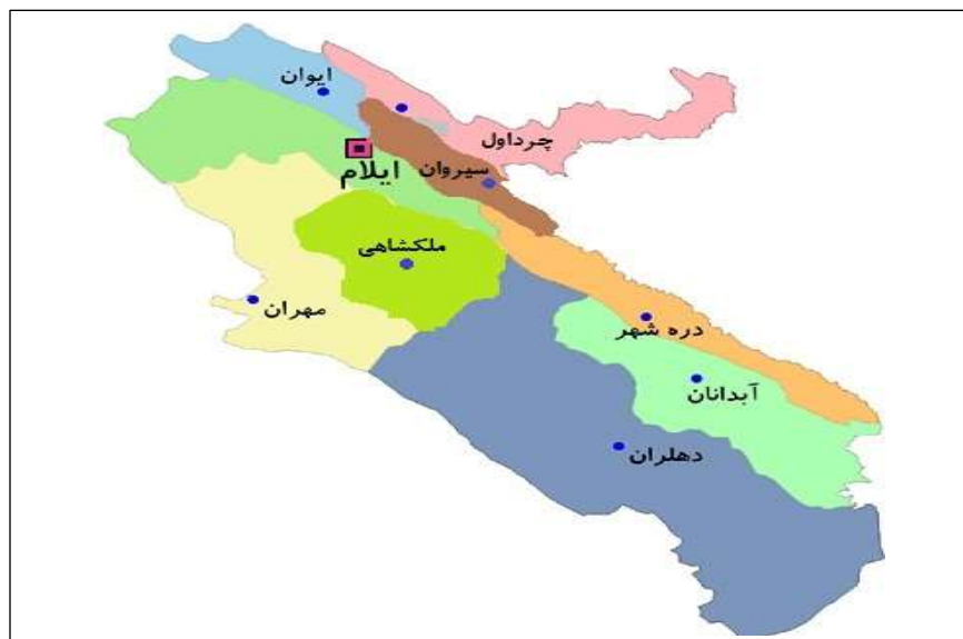
شکل ۲: موقعیت جغرافیای شهرستان دهلران در استان ایلام

شهرستان دهلران در جنوب ایلام و در فاصله ۹۱۰ کیلومتری تهران واقع شده است. دهلران آب و هوای بیابانی و نیمه بیابانی «گرم و خشک» دارد. این شهرستان در جنوب شرقی استان ایلام و جنوب غربی دینار کوه و در فاصله ۲۲۸ کیلومتری ایلام و ۱۰۰ کیلومتری شهرستان اندیمشک واقع شده است. این شهر که در دامنه جنوب و جنوب غربی دینار کوه قرار دارد. شکل ۲ موقعیت جغرافیای شهرستان دهلران در استان ایلام را نشان می دهد.