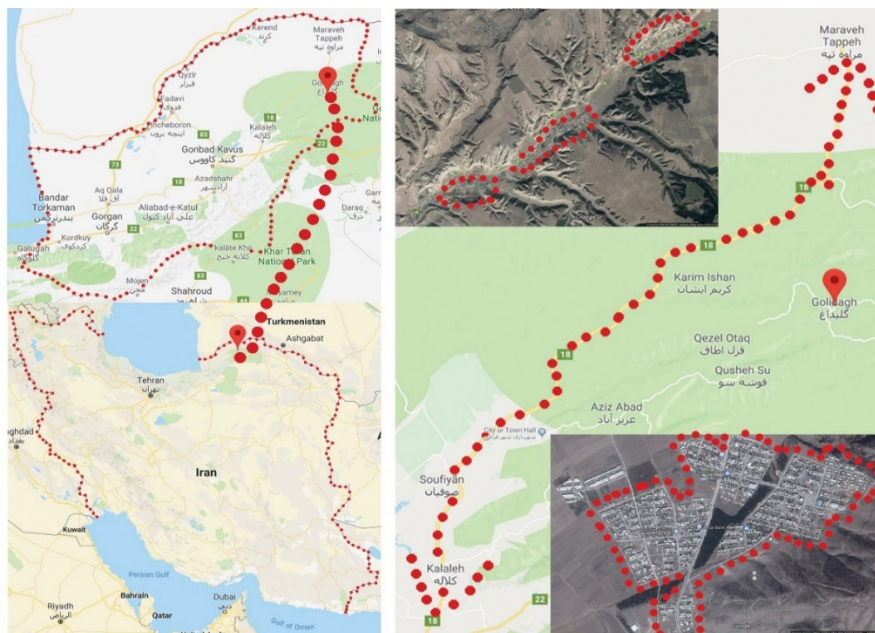
شکل ۱: روستاهای آسیب دیده و محدوده جابه جا شده پس از سیل ۸۴ استان گلستان

بارش باران های شدید در مرداد سال ۱۳۸۴ در نواحی شرقی استان گلستان منجر به وقوع دو سیل ویرانگر شد که از خسارت بارترین سیل های رخ داده در کشور بودند. (محمدی استادکلایه و همکاران، ۱۳۹۴) بنیاد مسکن انقلاب اسلامی در جهت تأمین اسکان جمعیت آسیب دیده و به منظور کاهش آسیب پذیری کالبدی مجدد روستاها در اثر وقوع سیلاب های آتی اقدام به جابه جایی یازده روستای شهرستان کلالة بانام های قزل اطاق، آق طوقه، چاتال، خوجه لر، کروک، پاشایی، قپان علیا، قپان سفلا، سیدلر، شیخلر و دوجی که در سیلاب های اخیر گرگان رود و سرشاخه های آن خسارات زیادی دیده بودند، به منطقه پیشکمر نمود. (پهلوان زاده و همکاران، ۱۳۹۱) از جابه جایی و تجمیع روستاها در این محدوده، شهر جدید فراغی شکل گرفت. در شکل ۱ موقعیت محدوده مورد مطالعه را نشان داده شده است.