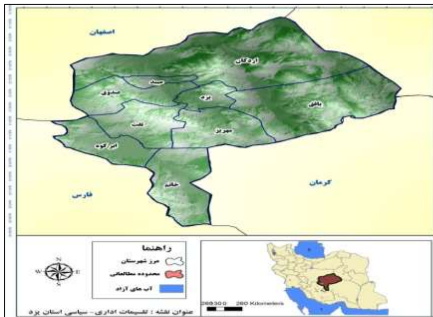
شکل ۱: محدوده مطالعه، استان یزد.