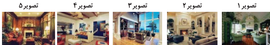
جدول ۲. ده تصویر انتخابی

داشتن مصالح طبیعی، بزرگ یا کوچک بودن بازشو، شیب‌دار یا صاف بودن سقف، ارتفاع بلند یا کوتاه فضای داخلی، وجود شومینه، نوع فرش کف (سرامیک و پارکت یا فرش و موکت)، بزرگی یا کوچکی فضای نشیمن، محصور بودن یا نبودن اطراف نشیمن، رنگ‌های گرم یا سرد و خنثی، وجود ستون در فضای نشیمن، استفاده از لوستر برای تأمین نور مصنوعی و عناصر دکوراتیو کم یا زیاد داشتن. ۱۰ تصویر نماینده بر اساس دارا بودن اکثریت ویژگی‌های ذکر شده انتخاب شد. جدول ۲ تصاویر انتخابی را نشان می‌دهد.