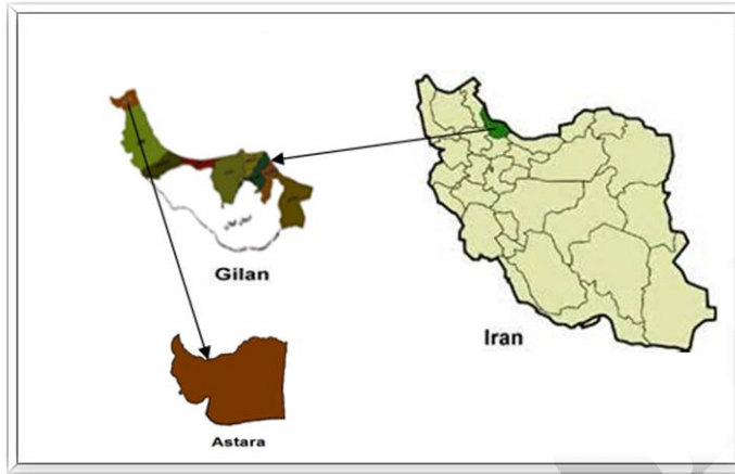
شکل ۱: موقعیت شهرستان مرزی آستارا