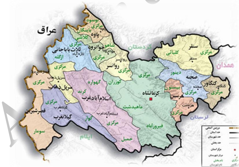
شکل ۱: نقشه استان کرمانشاه

محورهای ورودی قاچاق کالا در این استان شامل مناطق پاوه، قصر شیرین، اسلام‌آباد غرب و گیلان غرب می‌باشد. اجناس قاچاقی که از مرزهای استان کرمانشاه وارد کشور می‌شوند مواردی چون سیگار، پارچه، شکر، مشروبات الکلی، کالاهای ضد فرهنگی، لوازم آرایشی و بهداشتی، لوازم صوتی و تصویری، لوازم خانگی و سلاح و مهمات را دربر می‌گیرد. همچنین شیوه‌های ورود قاچاق کالا به استان کرمانشاه شامل ترانزیت خارجی و داخلی، بازارچه‌های مرزی به صورت زیرباری، جعل مدارک و پلمپ گمرکی و کوله باری می‌باشد (سیف، ۱۳۸۷: ۶۳).