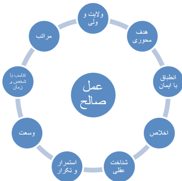
شکل دو. مؤلفه‌های معنایی عمل صالح.

«ایمان»، شرط پیشینی عمل صالح و «هدف»، شرط پسینی آن است و «ولئ» و «عقل»، دو حجت برای تعیین هدف و این «هدف» است که حُسن فعلی و فاعلی عمل را نسبت به شخص و زمان رقم می‌زند. اخلاص، استمرار، تکرار، وسعت، تناسب و مراتب نیز از دوایر معنایی عمل صالح به‌شمار می‌آیند. بر اساس این، مصداق «عمل صالح»، یک تعریف خطی ندارد که در همه‌ی زمان‌ها و برای همه‌ی اشخاص، «عمل صالح» به‌شمار آید، بلکه به تناسب شخص و زمان، متغیر است؛ یعنی یک «عمل صالح» - مصداقی و نه مفهومی - می‌تواند در یک زمان و برای شخصی «عمل صالح» به‌شمار آید و همان عمل، در زمان دیگری و برای شخص دیگری، «عمل صالح» نباشد.