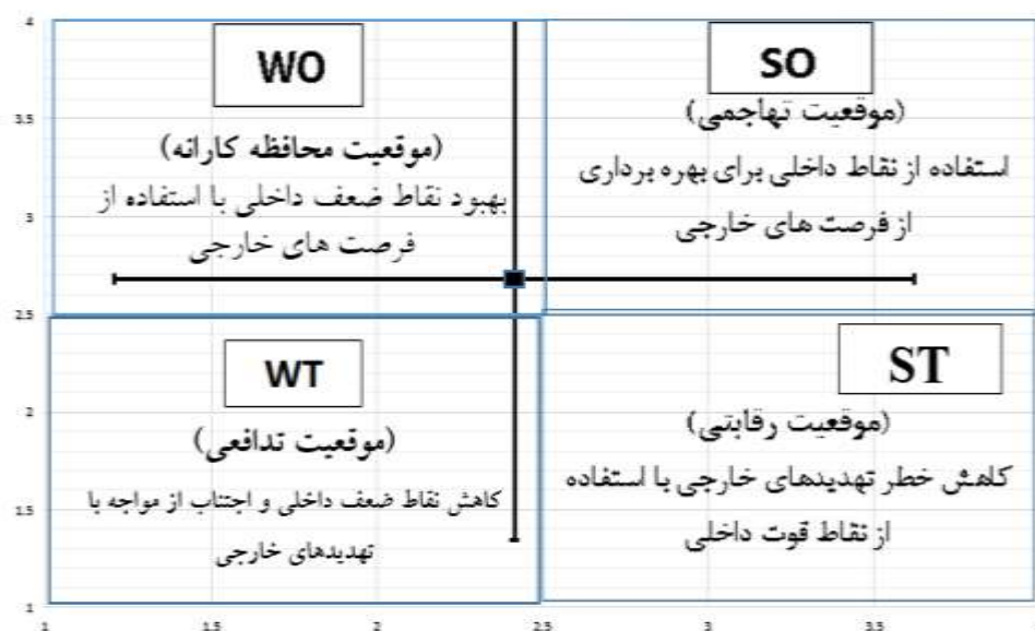
شکل ۳- ماتریس ارزیابی عوامل داخلی و خارجی (IE) دیپلماسی شهری کلان شهر مشهد

پس از شناسایی قوت‌ها، ضعف‌ها، فرصت‌ها و تهدیدها و پس از اینکه ماتریس‌های (IFE) و (EFE) تشکیل و تحلیل شد، اکنون به تحلیل ماتریس (IE) یا همان ماتریس تحلیل عوامل خارجی و داخلی پرداخته می‌شود. در ماتریس ارزیابی عوامل داخلی (IFE) نمره نهایی عدد (۲/۳۵۹) بوده که بر روی محور (X)‌ها جایگاه قرارگیری آن مشخص می‌شود و همچنین نمره نهایی در ماتریس ارزیابی عوامل خارجی (EFE) برابر عدد (۲/۵۲۷) بوده که بر روی محور (Y)‌ها جایگاه قرارگیری آن مشخص می‌شود. عمود بر نقاط مشخص شده خطی در محور مختصات ترسیم می‌شود که محل تقاطع خط در یکی از چهار استراتژی (تهاجمی SO، محافظه کارانه WO، رقابتی ST، تدافعی WT) است که این عمل در واقع موقعیت استراتژیک دیپلماسی شهری کلان شهر مشهد را در وضعیت فعلی، مشخص می‌نماید.