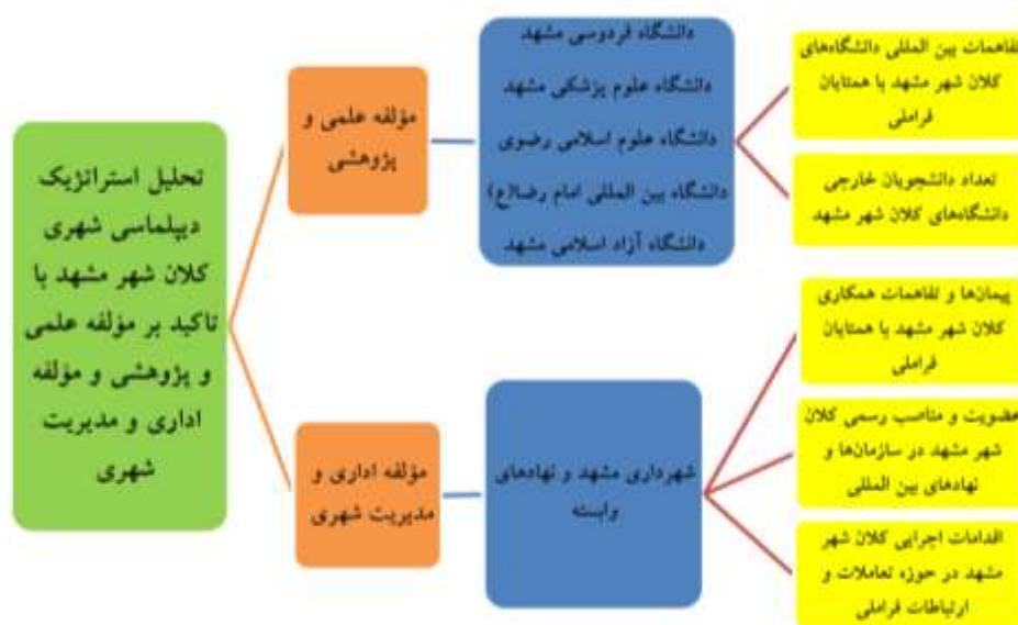
شکل ۲-مدل مفهومی پژوهش

در ادامه از میان چهار مؤلفه ی شکل ۱؛ با توجه به تمرکز پژوهش، مدل اصلی در قالب دو مؤلفه علمی و پژوهشی که دانشگاه‌ها یکی از بازوهای اصلی آن را، تشکیل می‌دهند و مؤلفه اداری و مدیریت شهری با تمرکز ویژه بر فعالیتهای نهادهای مدیریت شهری (شهرداری مشهد) و واحدهای وابسته به آن، به بررسی دیپلماسی شهری کلان شهر مشهد، پرداخته شده است.