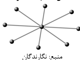
شکل ۱. شبکه ستاره

بروکنر (۲۰۰۳) در یک مدل‌سازی مشابه دو وضعیت را بررسی می‌کند: شبکه با محوریت فردی که همه را می‌شناسد ۵ و شبکه با یک فرد جذاب ۶ (شکل ۲). وی نشان می‌دهد که در هر دو مورد، احتمال شکل‌گیری هاب و رهبر در شبکه دوستی متحمل‌تر است.