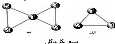
شکل ۲. الف - فرد جذاب، ب - همه را می‌شناسد

در بلندمدت مهاجرین زیادی در مقصد ساکن شده‌اند و مهاجرین جدیدتر امکان انتخاب بین همه مهاجرین قدیمی‌تر را ندارند و عملاً تعداد محدودی از افراد در دسترس‌شان