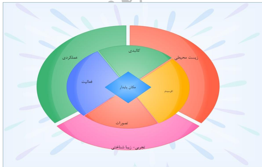
شکل ۱. مدل مفهومی پژوهش مبتنی بر چارچوب مکان پایدار [۱۸]

• ایده محدودیت های اعمالی آینده از سوی وضعیت فناوری و سازمان اجتماعی بر توان محیطی در پاسخگویی به نیازهای موجود و آینده [۲۳]. بر این اساس، توسعه پایدار توسعه ای است که سلامت بلندمدت نظام های انسانی و اکولوژیکی را بهبود می بخشد. این تعریف سعی می کند با تأکید بر حرکت پیوسته به سمت جوامع طبیعی و انسانی سالم تر از بحث های بی ثمر درباره مفاهیمی چون ظرفیت تحمل، نیازها، یا وضعیت نهایی پایداری حذر کند [۳۴]. مجموعه وسیعی از دیدگاه های مختلف به موضوع توسعه پایدار و مسائل آن معطوف شده است. بیشتر روش ها، ابزار و اهداف مختلف حصول به این رویکرد، از نیازها یا برخوردهای حرفه ای بروز می کند. برخوردها با تمرکز بر اکولوژی و طبیعت [Ecolocentrism] یا انسان [Anthropocentrism] یا ترکیبی از هر دو بوده است. چاپین و همکاران (۲۰۰۴) چهار رکن توسعه پایدار را چنین تبیین می کنند: طبیعت، اقتصاد، جامعه و آسایش. مطالعات شهری متأثر از چارچوب رویکرد توسعه پایدار، بر «مکان پایدار» برای تحقق کیفیت محیط تأکید دارند. در مدل چهاربعدی «مکان پایدار» مرکب از ابعاد چهارگانه محیط، سه مؤلفه «کیفیت عملکردی»، «کیفیت زیباشناختی» و «کیفیت زیست محیطی» به مثابه نیروهای شکل دهنده را می توان در جهت توسعه پایدار مورد بحث و آزمون قرار داد [۱۸].