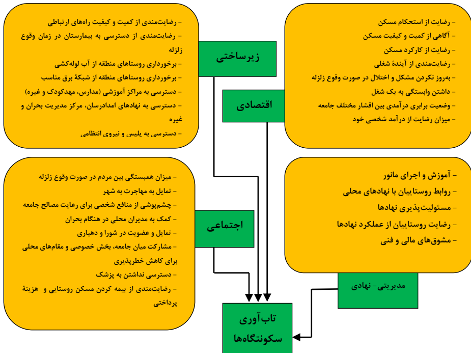
شکل ۲. ساختار شاخص‌ها و مؤلفه‌های تحت بررسی [۱۱، ۱۳، ۱۸].