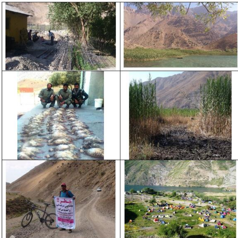
شکل ۲. نمونه ریسک‌ها و آسیب‌های دریاچه گهر