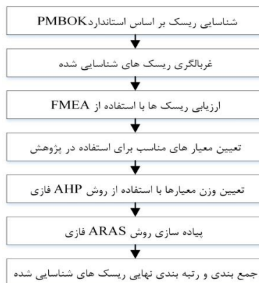
شکل ۲. مراحل اجرای پژوهش

در این پژوهش در هفت گام مطابق شکل ۲ به اجرای مفاهیم و رتبه‌بندی ریسک‌های موجود در پروژه‌های عمرانی با تمرکز بر پروژه‌های سدسازی پرداخته شد.