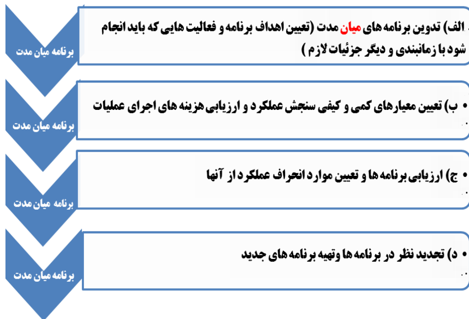
شکل ۲. فرآیند برنامه‌ریزی میان‌مدت (ایزدی، ۱۳۹۱: ۴۷)