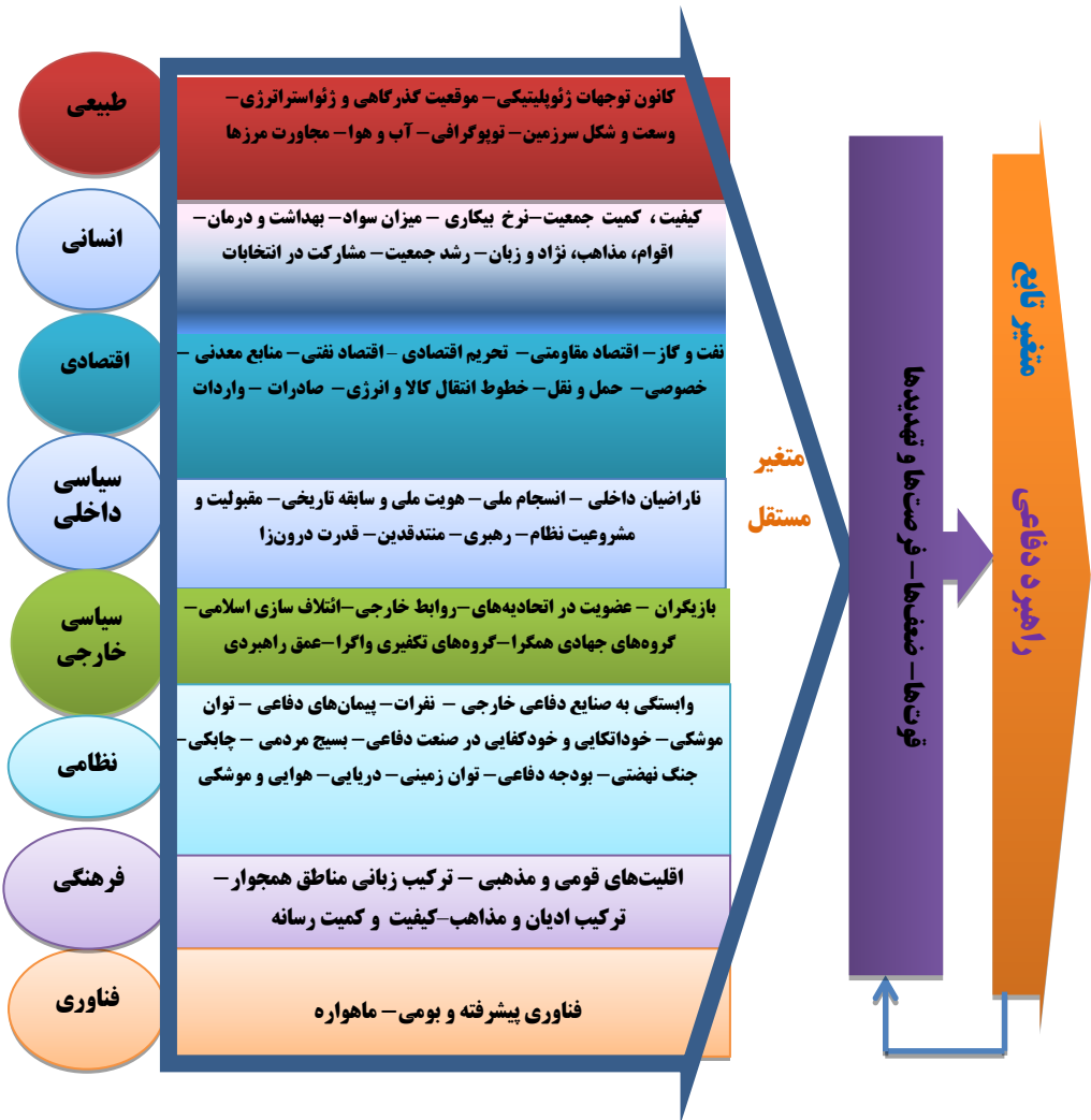
نمودار ۲. مدل مفهومی تحقیق

با توجه به سوالات، مبانی نظری و پیشینه‌های پژوهش، مدل مفهومی تحقیق به شکل ذیل (نمودار شماره ۲) ارائه می‌گردد: