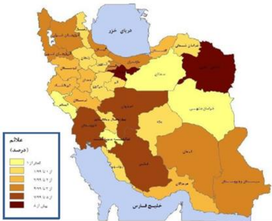
شکل (۱) توزیع نسبی جمعیت ایران ۱۳۹۵ هجری شمسی

ایران یا مناطق کوهستانی، تراکم جمعیت به حداقل می‌رسد. در توجیه علل تغییرات تراکم جمعیت در استان‌های مختلف، علاوه بر عوامل طبیعی، اقتصادی، اجتماعی و ...، وسعت استان‌ها و ناهم‌هنگی تقسیمات کشوری بر اساس نواحی طبیعی جغرافیایی، نقش تعیین‌کننده‌ای دارند (قدیری و همکاران: ۱۳۹۲: ۶۳).