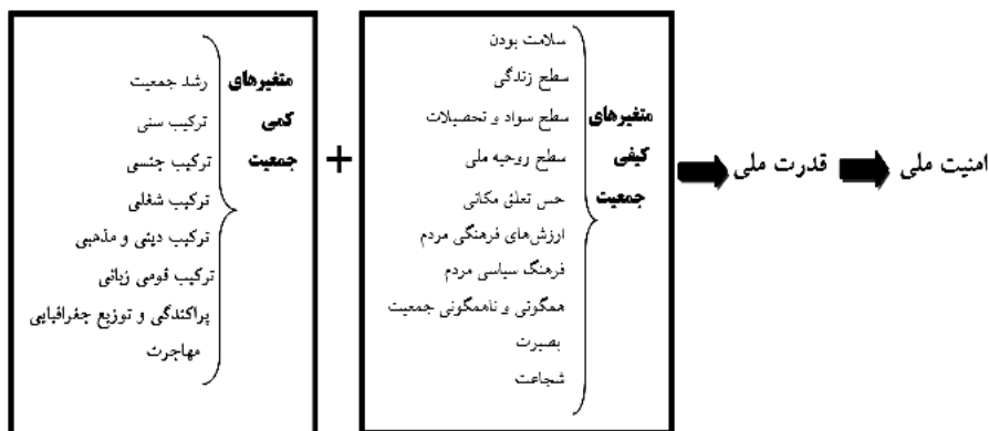
شکل شماره (۳) الگوی مفهومی تحقیق