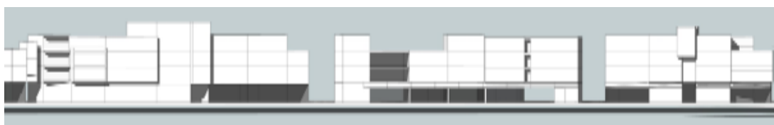
تصویر ۳- نمونه‌ای از نمای موجود و پیشنهادی پروژه.