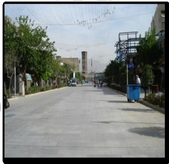
تصویر ۴- جانمایی خطی عناصر و عدم امکان

در پروژه مورد نظر نمای پیشنهادی برای این معبر طراحی شده است که در هنگام نوسازی ساختمان ها اجرا می شود. این بدنه پیشنهادی نیز فاقد بسیاری از معیارهای زیبایی شناسانه نظیر وجود ریتم، تعادل بصری، تعادل و خط آسمان هماهنگ است. بدنه پیاده راه با وجود تأمین حس محصوریت، فاقد خط آسمان هماهنگ است. در طرح پیشنهادی، برای اکثر نماها تغییراتی اساسی پیشنهاد شده است که با توجه به طولانی بودن افق این طرح تحقق این بخش از پروژه مستلزم گذر زمان است. علاوه بر موارد ذکر شده تغییرات اساسی در طول این مسیر می تواند موجب کاهش حس تعلق نیز شود.