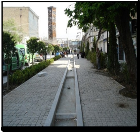
تصویر ۵- عدم توجه به آسایش اقلیمی.

موتور سوارها و حتی استفاده از دوچرخه به علت عدم وجود مسیر تعریف شده موجب می شود این پیاده راه نتواند امنیت افراد پیاده راه، که استفاده کنندگان اصلی آن هستند، تأمین نماید.