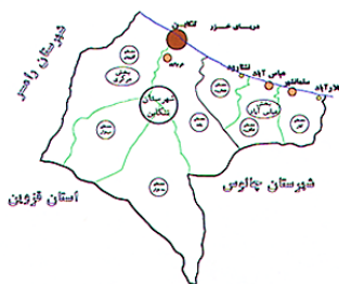
شکل ۱- موقعیت جغرافیایی شهرستان تنکابن