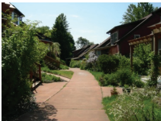
تصاویر ۱، ۲ و ۳- محلات همزیست به شیوه مجتمع و غیر مجتمع

خانواده‌ها کمتر است و می‌تواند یک جا جمع شود، در حالی که واحدهای شخصی فضای کافی برای فعالیت‌های روزانه فراهم می‌کند (Williams, 2008: 269-270).