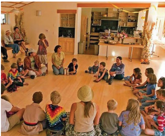
شکل ۴ و ۵- فضاهای عمومی و جمعی در محلات همزیست