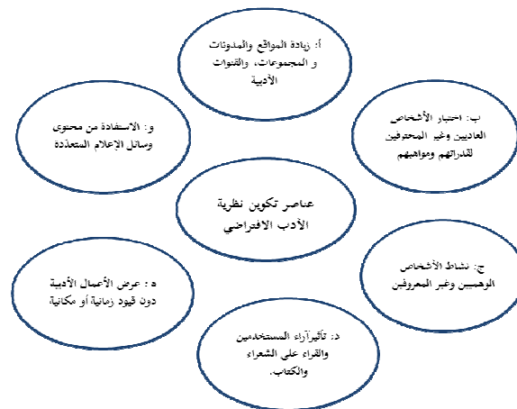
الشكل رقم ١- عناصر تكوين نظرية الأدب الافتراضي