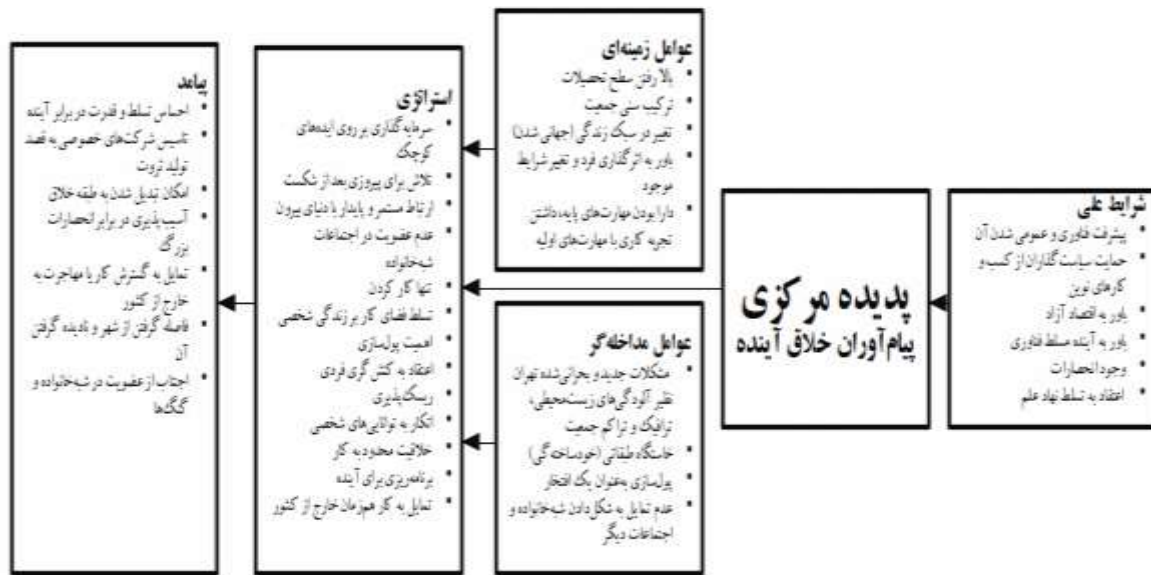
شکل ۳ - پیام‌آوران خلق آینده؛ پارادایم دوم برآمده از مطالعه حاضر در شهر تهران