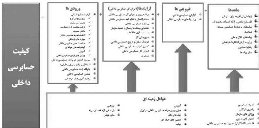
شکل ۱. مدل کیفیت حسابرسی داخلی

داداشی و همکاران (۱۳۹۶) در تحقیقی به بررسی تأثیر ویژگی‌های ساختاری واحد حسابرسی داخلی بر احتمال وقوع تقلب در صورت‌های مالی پرداخته‌اند. بدین منظور از داده‌های ۱۲۵ شرکت طی سال‌های ۱۳۹۱ الی ۱۳۹۴ استفاده شده است. یافته‌های تحقیق بیانگر آن بود که تجربه و دوره تصدی مدیر حسابرس داخلی به ترتیب دارای اثرات منفی و مثبتی بر احتمال وقوع تقلب در صورت‌های مالی شرکت‌های مورد بررسی هستند اما اثر معناداری از سوی سایر ویژگی‌های حسابرسی داخلی بر احتمال رخداد تقلب در صورتهای مالی مشاهده نشد.