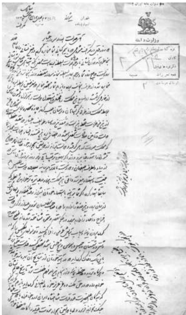
سند شماره ۱ (شناسه سند ۲۹۰/۲۸۷۲ سازمان اسناد و کتابخانه ملی): مامویت صولت الدوله جهت اعاده امنیت و آزادی کنسول‌های انگلیس از زندان واسموس و شیخ حسین در دشتستان