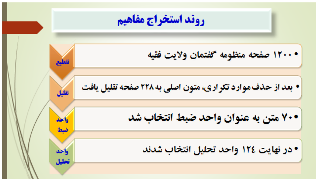
شکل ۱- روند استخراج مفاهیم از گفتمان ولایت فقیه

روش نظریه پردازی و مراحل اجرای آن با استفاده از روش داده بنیاد