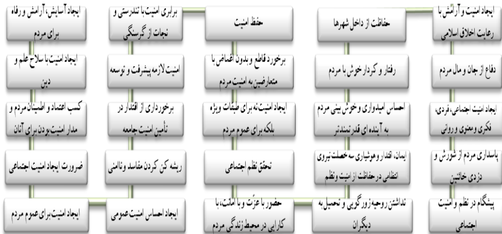
جدول شماره ۳ شاخص های احصاء شده مؤلفه امنیت عموم

مؤلفه حفظ و ارتقاء امنیت ملی از ۱۲ شاخص تشکیل گردیده که با حذف شاخص های تکراری،