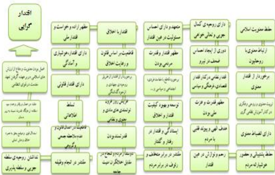
جدول شماره ۲ شاخص‌های احصاء شده مؤلفه اقتدارگرایی اسلامی