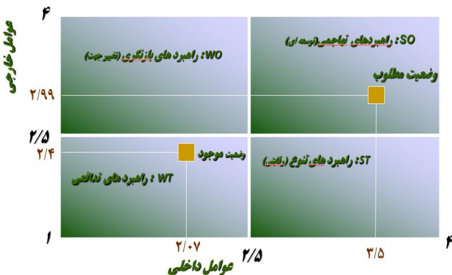
شکل ۲- تعیین موقعیت در ماتریس داخلی و خارجی IE

تهاجمی: استفاده از توانمندی‌ها برای استفاده از فرصت‌ها رقابتی: بهبود سیستم‌های درونی با استفاده از فرصت‌های بیرونی محافظه‌کارانه: بهبود شرایط محیطی با استفاده از توانمندی‌ها تدافعی: کاهش نقاط ضعف و پرهیز از تهدیدها