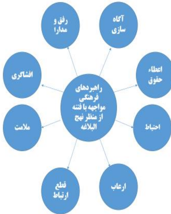
نمودار ۳. راهبردهای فرهنگی مواجهه با فتنه از منظر نهج البلاغه

فتنه‌ها به شمار آمده و در واقع تا زمینه‌های روشنگری در جامعه فراهم نشود، حاکمان، قدرت مهار فتنه‌ها با اقل هزینه و امکانات را نخواهند یافت. لذا هر کدام از راهبردهای دیگر به اقتضای شرایط موجود و مصلحت جامعه اسلامی قابل پیاده‌سازی خواهند بود.