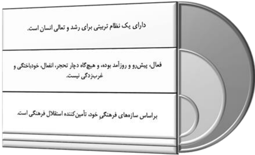
شکل ۱. ویژگی‌های «نظام فرهنگی» از منظر حضرت امام خمینی (ره)