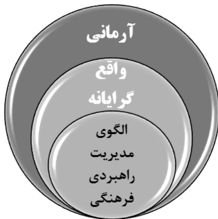
شکل ۲. سطوح راهبردی الگوی مدیریت فرهنگی