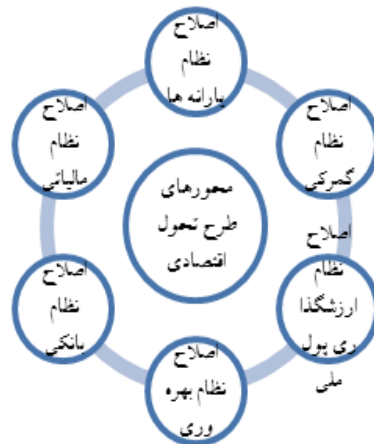
شکل ۱. محورهای طرح تحول اقتصادی

از جمله تجربیات نظام جمهوری اسلامی می‌توان به اقدامات دولت در خصوص طرح تحول اقتصادی اشاره کرد. طرح تحول اقتصادی دارای هفت محور بود که یکی از محورهای آن اصلاح نظام گمرکی است. اصلاح نظام گمرکی جزء اولویت‌های اساسی در سیاست‌های ابلاغی و اقدامات دولت‌ها در سال‌های اخیر بوده است. این رویکرد در شکل شماره ۱ نشان داده شده است: