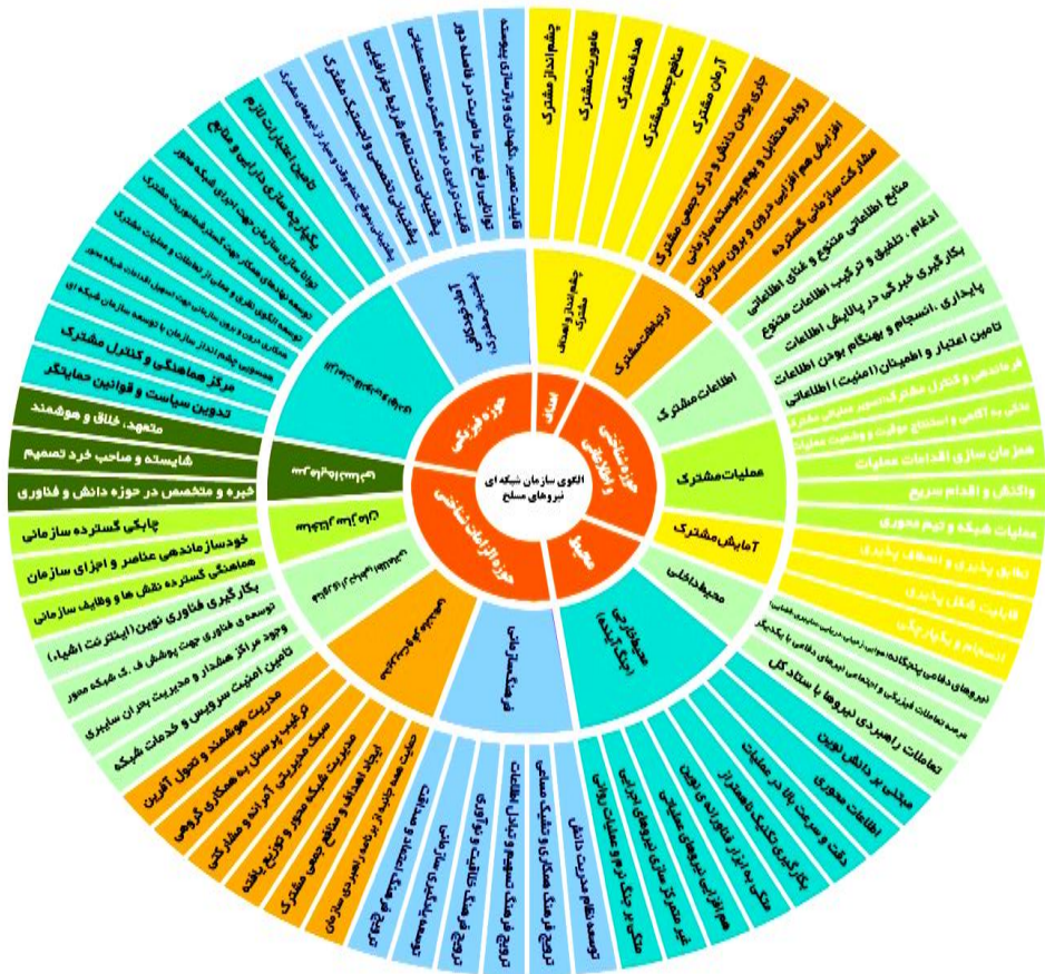
شکل ۱ مدل مفهومی پژوهش: سازمان شبکه‌ای نیروهای مسلح در فضای جنگ‌های آینده

تهدیدات بالقوه و بالفعل نیروهای مسلح به ارائه الگویی بومی برای سازمان‌های شبکه‌ای پرداخته‌ایم. این الگو که مستخرجه از مطالعات اکتشافی و تحلیل اسناد و مدارک موجود در ادبیات و مبانی نظری و بررسی عمیق نظرات خبرگان حوزه پژوهش است مدل مفهومی مطابق شکل ۱ می‌باشد.