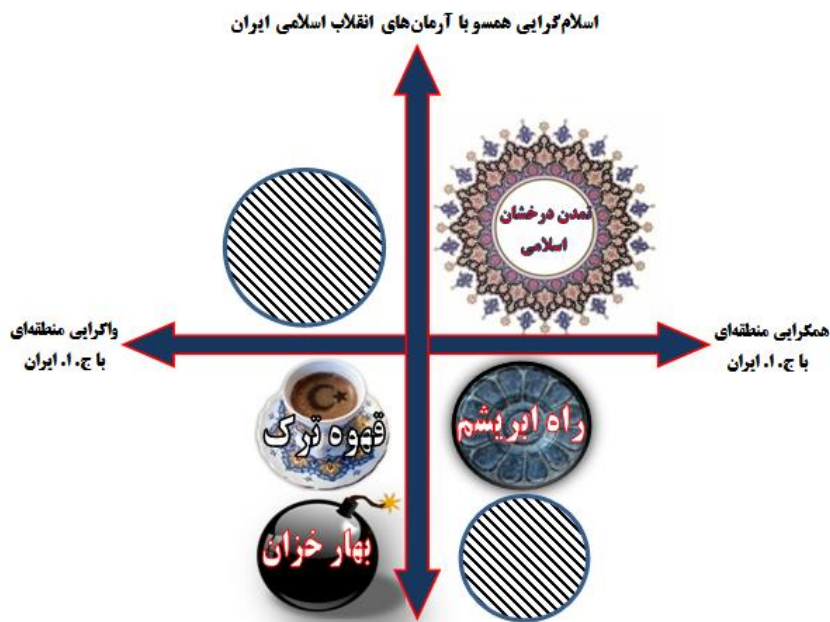
اسلام‌گرایی همسو با اندیشه‌های سکولار - اسلام‌گرایی همسو با اندیشه تکفیری

با توجه به آینده‌های باورپذیر تحولات بیداری اسلامی در آسیای مرکزی، فضای سناریوهای بیداری اسلامی در آسیای مرکزی به شکل ۱ ترسیم شده است.