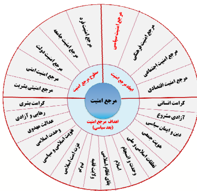
شکل شماره ۳: مدل مرجع امنیت (محقق یافته)

مرجع امنیت در اندیشه سیاسی امنیتی رهبری با توجه به نگاه توسعه‌ی به امنیت ملی، چند سطحی، چند بعدی و چند وجهی است. مطابق دیدگاه رهبری، برای تعیین مرجع امنیت باید سطوح پنجگانه فردی، جمعی، ملی، امتی و جهانی (بشری) را مد نظر قرارداد. هر سطحی از سطوح فوق، ابعادی دارد که متناسب با ابعاد امنیت است و بعد سیاسی یکی از ابعاد مهم آن می‌باشد؛ و اهداف مرجع امنیت در هر بعدی از ابعاد امنیت ملی نیز چند وجهی است،