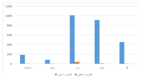
نمودار شماره (۱). بسامد کاربرد صفتی اسم‌ها در فرایند صفت‌سازی

چنانکه جدول فوق نشان می‌دهد، صفت‌های <شیء، توصیف> مورد بررسی مهم‌ترین زیرمعیار که در واقع نقش اولیه صفتی است را برآورده نکرده‌اند، که آنها را از صفت‌های سرنمون جدا می‌کند و به صفت‌های غیرسرنمون نزدیک می‌کند. با این حال، این صفت‌ها به یک اندازه غیرسرنمون نیستند، بلکه در یک پیوستار قرار دارند. نمودار زیر نشان‌دهنده میزان بسامد این کلمات در دو نقش اسمی و صفتی در بیکره بیجن خان است: