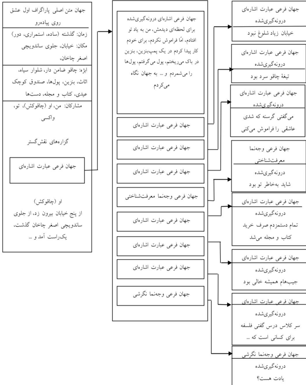
جدول (۳). جهان‌های فرعی بند نخست داستان عشق روی پیاده‌رو (مستور، ۱۳۹۰: ۶۵-۷۷)

شخص گستر و دو نمونه گزاره ربطی موجود در این بند مانند: «به فکر یک لقمه نان باش...» و «گرسنه که شدی عاشقی را فراموش می‌کنی» کارکرد موضوع گستر دارند.