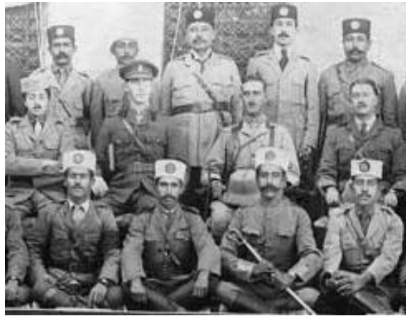
تصویر ۱۱- جمعی از نیروهای پلیس جنوب به فرماندهی افسران انگلیسی

الثانی ۱۳۴۴ق از سلطنت برکنار شد (مکی، ۴). این دوره را باید یکی از بحرانی‌ترین و خطرناک‌ترین ادوار تاریخ ایران دانست، زیرا در این دوره، استقلال کشور متزلزل شد. دورانی متلاطم و پر آشوب که همه چیز هم‌زمان سوخت و نابود شد بنابراین، از ارتش جز نامی و از نیروهای مسلح جز شبحی در سراسر کشور به جای نمانده بود (کاظمی، ۳۹). در این عصر نیز لباس قزاق‌ها همچنان مشابه قزاقان روسی بود (همان، ص ۴۱)؛ اما در رسته پلیس جنوب لباس نظامیان ایرانی کاملاً شبیه به لباس افسران انگلیسی تهیه شد. همچنان که در تصویر ۱۱ به چشم می‌خورد، تنها در کلاه و ملحقاتی نظیر نشان‌های روی کلاه و لباس متناسب با فرهنگ بومی ایرانی تفاوت وجود داشت.