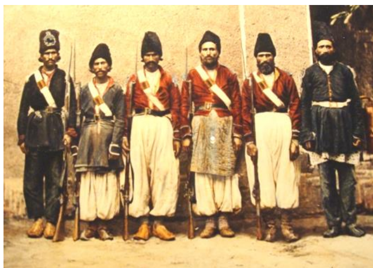
تصویر ۲- سربازان ایرانی