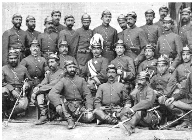
تصویر ۳- سربازان اتریشی، سایت کافه تاریخ