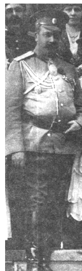
تصویر ۹- قزاق قفقازی

یک سفرنامه‌نویس آلمانی نیز به نوعی پوشش سرشش تن از نگاهبانان قدبلند محمدعلی‌شاه که دو طرف پله‌ها خبردار ایستاده بوده‌اند، اشاره کرده است. این پوشش کلاه‌خودهای پروسی با نوک تیز بود که یکی دیگر از سوغات‌های سفر فرنگ شمرده می‌شد (گروته، ۲۱۲).