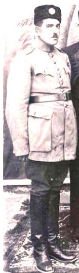
تصویر ۱۰- افسر ایرانی

پس از اندک زمانی طرح جدیدی از لباس قزاق‌ها باب شد. این لباس پیراهنی کوتاه بود با جلو سینه بسته، یقه لبه‌دار، چاک دکمه‌خور سمت چپ شانه و شلوار (نیم گالیفه) و چکمه، با کلاه پوستی و کمر بند باریک و دو چاک کوچک در پهلوها، با تغییر و تبدیلی مختصر در پارچه، دوخت، زیور سرآستین‌ها، لبه دامن و دور یقه‌ها به تناسب مناصب بالا و پستی مقام متفاوت بود (شهری، ۵۰۴/۲). در تصویر ۹، با بررسی جزئیات لباس نمونه دیگر قزاق قفقازی، در مقایسه با لباس سرتیپ فضل‌الله زاهدی فرمانده قوای فارس در تصویر ۱۰ پی می‌بریم که تأثیرپذیری طرح لباس قزاق قفقازی بر البسه نظامیان اواخر دوره قاجار تماماً اجرا شده است؛ با این تفاوت که افسر قفقازی کلاه کاسکت و افسر ایرانی کلاه پوست (کلاه ملی) بر سردارند و پیراهن افسر ایرانی بلندتر از پیراهن افسر روسی است.