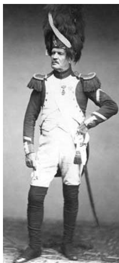
تصویر ۱- نظامی فرانسوی (۱۸۰۰م)، کتابخانه براون

تصویر توسط لوئیجی مونتابونه، عکاس هیئت ایتالیایی مأمور در ایران، در سال ۱۲۷۹ق/۱۲۴۱ش گرفته شده است.