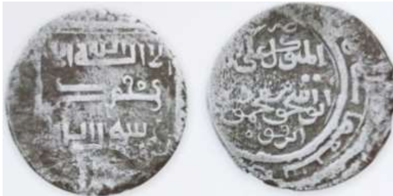
(علاءالدینی، سکه‌های ایران از انقراض ایلخانان مغول تا استیلای تیمور گورکان، ۲۱)