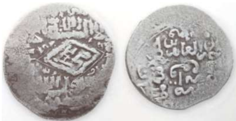
(علاءالدینی، سکه‌های ایران از انقراض ایلخانان مغول تا استیلای تیمور گورکان، ۱۶۰)

سکه شماره ۴: سکه‌ای از دوره زین العابدین مظفری (حک: ۷۸۶-۷۸۹ق) موجود است که ۱/۶۹ گرم وزن و ۲۰/۸ میلی متر قطر دارد. آسیب دیدگی طرح احتمالی روی سکه را از بین برده است. با وجود این، در مرکز نوشته‌ها از سمت راست به چپ چنین نوشته شده است: «زین العابدین خلد الله ملکه»، سپس از پایین به بالا مکان ضرب سکه آمده است: «ضرب ابرقوه». سال ضرب سکه در جهت حرکت عقربه‌های ساعت نقر شده است: «ثمان و ثمانین و سبعمائه». [۷۸۸ق]. در پشت سکه از بالا به پایین و به خط کوفی چنین نوشته شده است: «الله لا اله الا الله محمد [درون یک طرح لوزی] رسول الله». در حاشیه اسامی خلفای راشدین نقر شده است: «ابوبکر/عمر/عثمان/علی».