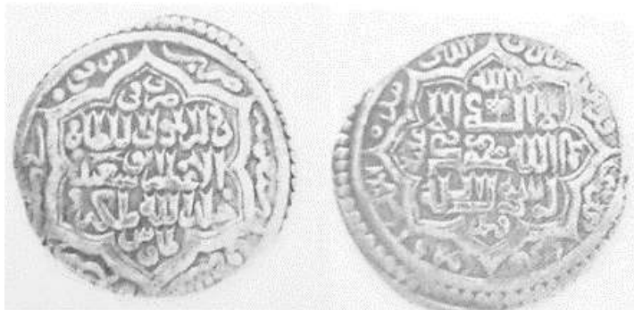
(علاءالدینی، سکه های ایران دوره ایلخانان مغول، ۳۰۱)

برگرفته و در میان آن‌ها عبارت «تبارک الذی بیده الملک و هو علی کل شیء قَدیر» ۱ نوشته شده و یک نشان حکومتی بر روی «اله» دیده می‌شود. در پشت سکه دو طرح شش ضلعی درون یکدیگر قرار دارند و در درون آن چنین نوشته شده است: «ضرب فی الدوله المولی السلطان الاعظم ابوسعید خلدالله ملکه طابوس». در حاشیه سکه چنین نوشته شده است: «ضرب ابرقوه فی سنة سبع عشر و سبعمائۀ» [۷۱۷ق].