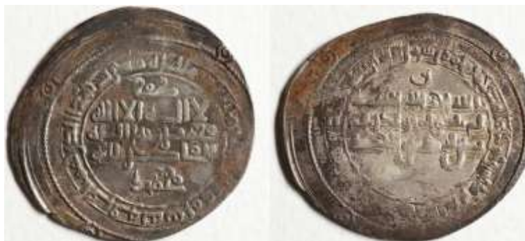
(موزه ملی ملک، شماره سکه ۳۹۴، شماره اموال ۱۴۳).

اطراف خود دارد. طرح روی سکه در پشت سکه نیز تکرار شده است. در مرکز، دایره‌ای قرار دارد که نوشته‌های آن به خط کوفی ساده عبارت‌اند از: «الله احد الله الصمد لم یلد و لم یولد ولم یکن له کفوا احد». در حاشیه علاوه بر «محمد رسول الله»، آیه ۳۳ سوره بقره نقر شده است: «ارسله بالهدی و دین الحق لیظهره علی الدین کله ولو کره المشرکون».