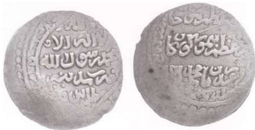
(علاءالدینی، سکه‌های ایران دوره گورکانیان، ۲۴)

سکه شماره ۲: این سکه ۶/۱۴ گرم وزن و ۲۸/۴ میلی متر قطر دارد. نوشته‌های پشت سکه به خط کوفی تزئینی درون یک دایره قرار دارند: «لا اله الا الله محمد رسول الله ضرب مدینه طاسوس». حاشیه سکه به دلیل آسیب دیدگی قابل خواندن نیست. در روی سکه نیز نوشته‌ها درون یک دایره قرار گرفته‌اند و به ترتیب از بالا به پایین عبارت‌اند از: «سلطان اعظم محمودخان امیر اعظم تیمورگورکان ولی عهد زمان محمد سلطان خلد ملکهم». حاشیه روی سکه آسیب دیدگی دارد و فقط عبارت «سنة اربع» را می‌توان خواند.