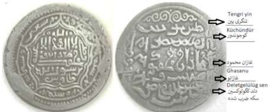
(علاءالدینی، سکه‌های ایران دوره ایلخانان مغول، ۱۲۷)

فلوس ۱ غازانی: از دوره غازان فلوس ضرب طاوس در دست است که ۲/۳۲ گرم وزن و ۲۰ میلی‌متر قطر دارد. بر روی فلوس و درون یک دایره که با نقطه‌چین طراحی شده عبارت «طاوس» دیده می‌شود و این دایره با دو مربع احاطه شده است. به نظر می‌رسد اسامی خلفای راشدین در حاشیه نقر شده باشد. نوشته‌های پشت فلوس هم به خط اویغوری است که با نوشته‌های سکه پیشین یکی است.