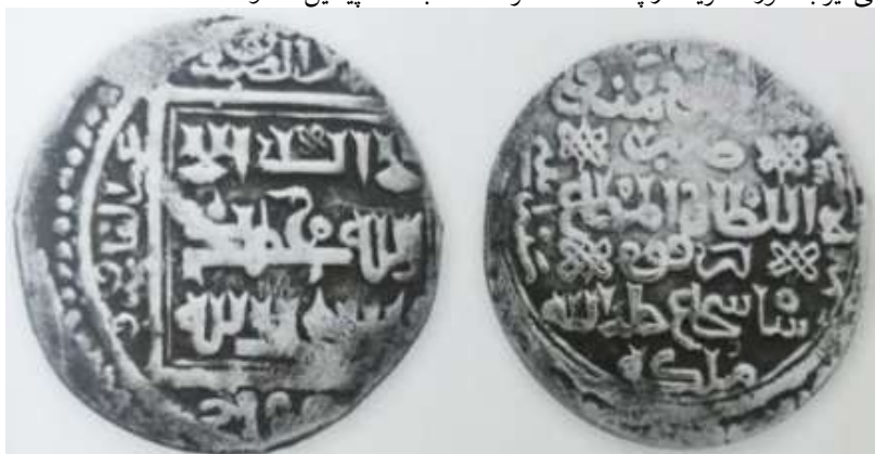
(علاءالدینی، سکه‌های ایران: از انقراض ایلخانان مغول تا استیلای تیمور گورکان، ۱۳۴)

سکه شماره ۳: این سکه ۲/۸۲ گرم وزن و ۲۲/۲ میلی متر قطر دارد. در روی سکه مربعی درون دایره طراحی و نوشته‌ها به خط کوفی تزئینی است: «لا اله الا الله محمد رسول الله». در حاشیه اسامی خلفای راشدین به همراه القاب آن‌ها و عکس جهت حرکت عقربه‌های ساعت نقر شده است: «ابوبکر الصديق/ عمر الفاروق/ عثمان ذی النورین/ (علی المرتضی)». نوشته‌ها درون یک دایره بزرگ در پشت سکه نقر شده است: «امیرالمؤمنین و/ ضرب/ السلطان المطاع/ ابرقوه/ شاه شجاع خلد الله ملکه». در حاشیه نوشته‌ها و از سمت چپ به راست سال ضرب سکه آمده است: «سنة اثني و سبعين و سبعمائه». [۷۷۲ق]. چهار نشان حکومتی نیز به صورت قرینه در پشت سکه نقر شده که با سکه پیشین متفاوت است.