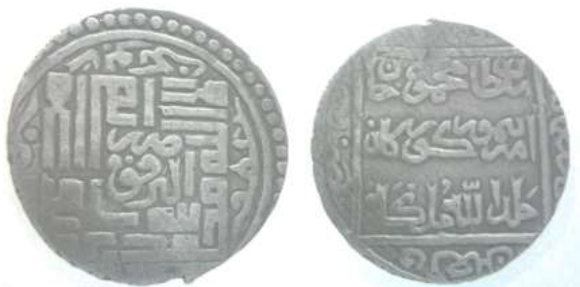
(علاءالدینی، سکه‌های ایران دوره گورکانیان، ۴۷)

بزرگ و تقریباً در مرکز سکه نقره شده و چیش جالبی دارند: «لا اله الا الله/ [به خط ثلث] ضرب ابرقوه/ محمد رسول الله». در حاشیه اسامی خلفای راشدین در مسیر جهت عقربه‌های ساعت حک شده که اسامی «ابوبکر» و «عمر» را می‌توان خواند. نوشته‌ها به خط ثلث در پشت سکه درون یک مربع قرار دارند: «سلطان محمودخان امیر تیمور گورکان خلدالله ملکه». در حاشیه سکه سال ضرب آمده است: «فی شهر/ سنة سبع/ و تسعين/ و سبعمائه» [۷۹۷ق].