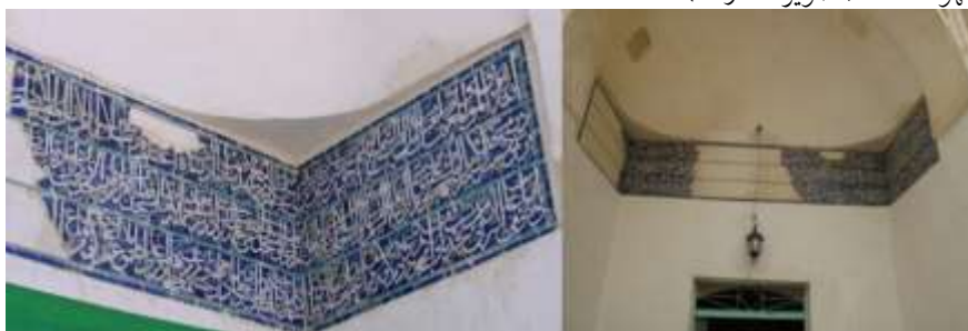
تصویر شماره ۲. کتیبه سردر مسجد بیرون در ابرکوه

مقبره، اکنون قبر طائوس الحرمین در داخل کتابخانه تکیه محله طائوس در منطقه نظامیه ابرکوه قرار دارد. این محله از قدیم الایام محل سکونت دراویش بود و امروز به محله درویش‌ها هم شهرت دارد. مزار طائوس اوقاف فراوانی داشت که در بقایای کتیبه سردر مسجد بیرون ابرکوه ۱ هنوز نام طائوسیه و برخی از اوقاف مشهود است ۲ (تصویر شماره ۲).