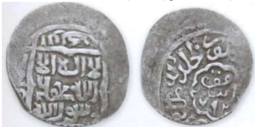
(علاءالدینی، سکه‌های ایران: از انقراض ایلخانان مغول تا استیلای تیمور گورکان، ۱۶۲)

سکه شماره ۵: سکه‌ای از شاه منصور (حک: ۷۹۰-۷۹۵ق)، آخرین پادشاه آل مظفر در دست است که دقت لازم در ضرب ندارد. این سکه ۱/۰۴ گرم وزن و ۱۷/۴ میلی متر قطر دارد. بر روی سکه و درون طرحی مربع شکل، به خط کوفی تزئینی چنین نوشته شده است: «لا اله الا الله محمد رسول الله». دایره‌ای نوشته‌های مرکز سکه را دربرگرفته و در حاشیه اضلاع مربع، اسامی خلفای راشدین عکس جهت حرکت عقربه‌های ساعت نقر شده است: «ابوبکر/عمر/عثمان/علی». در پشت سکه و درون یک طرحی با هشت قوس، محل و سال ضرب سکه آمده است: «ضرب ابرقوه/۷۹۲». به دلیل آسیب دیدگی در حاشیه، فقط عبارت «منصور خلد الله ملکه» را می‌توان مشاهده کرد.