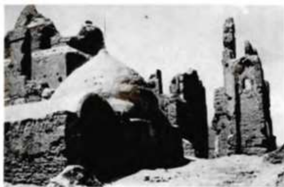
تصویر شماره ۱. مقبره طاوس الحرمین (گدار، آثار ایران، ج ۳، ۴، بخش دوم، ۲۴۰)

سکه‌های ضرب طاوس را معرفی ۱ و فقط در پاورقی اشاره‌ای به دارالضرب کرده است. ۲ با توجه به ضرورت بحث، پژوهش حاضر به دو موضوع مهم که در پژوهش‌های پیشین مورد غفلت واقع شده، پرداخته است: معرفی ابرکوه به‌عنوان جایگاه دارالضرب طاوس و بررسی و تحلیل سکه‌های دارالضرب این شهر که بیش‌تر آن‌ها در مجموعه شخصی ۳ نگه‌داری می‌شوند و تاکنون معرفی نشده‌اند.