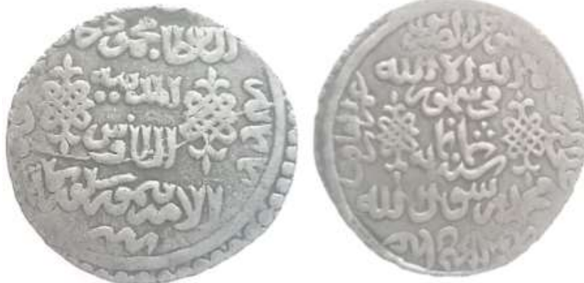
(علاءالدینی، سکه‌های ایران دوره گورکانیان، ۲۴)

سکه شماره ۴: این سکه در سال ۸۰۰ق ضرب شده و ۶/۱۸ گرم وزن و ۲۸/۲ میلی متر قطر دارد. عنوان محل ضرب «ضرب مدینه طابوس» است و از نظر طرح و نوشته با سکه دیگر که «ضرب ابرقوه» دارد، یکسان است. در روی سکه به ترتیب از بالا به پایین چنین نوشته شده است: «لا اله الا الله/ فی شهر ثمانمائه/ محمد رسول الله». در دو سمت نوشته‌ها دو نشان حکومتی نقر شده و اسامی خلفای راشدین برخلاف جهت حرکت عقربه‌های ساعت در حاشیه آمده است: «ابوبکر الصدیق/ عمر الفاروق/ عثمان ذی النورین/ علی المرتضی». در پشت سکه و درون دایره به ترتیب از بالا به پایین چنین نوشته شده است: «السلطان محمودخان المدینه الطابوس امیر تیمور گورکان». در حاشیه سکه چنین نوشته شده است: «فی شهر سنة ثمانمائه». دو نشان حکومتی نیز در دو سمت نوشته‌ها نقر شده است.