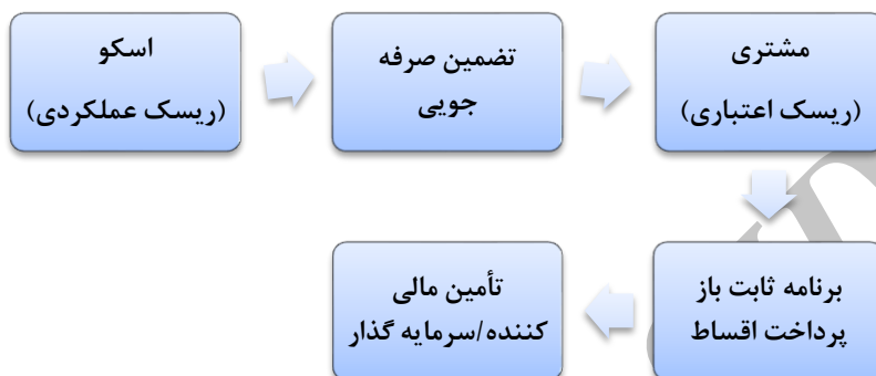
شکل ۲. کلیات روش کار قرارداد تضمین صرفه‌جویی انرژی

در این نوع از قراردادها، قرارداد خدمات انرژی بین کارفرما (مصرف کننده انرژی) و شرکت خدمات انرژی منعقد می‌گردد و مطابق آن شرکت خدمات انرژی تحقق مقدار مشخصی صرفه‌جویی انرژی را برای مصرف کننده تضمین می‌نماید. هزینه اجرای پروژه توسط کارفرما تأمین می‌گردد که یا خود آن را پرداخت نموده و یا اینکه از طریق دریافت وام از بانک یا بنگاه‌های مالی و اعتباری تأمین می‌گردد. (درس، ۲۰۰۳، ص ۴)