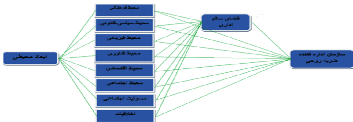
نمودار ۴: الگوی مفهومی تحقیق

برای سنجش الگو، مؤلفه‌های تأیید شده در دور اول را به همراه شاخص‌های آن، در قالب پرسشنامه‌ای که به پرسشنامه دور دوم دلفی مشهور بود انتقال داده شد. در این مرحله، محقق به دنبال رتبه‌بندی شاخص‌های هر مؤلفه بوده و از پاسخ‌دهندگان خواسته شده بود که شاخص‌های مطرح شده در هر مؤلفه را با درج اعداد ۱، ۲، ۳... رتبه‌بندی کنند. در پایان این مرحله، مهم‌ترین و تأثیرگذارترین شاخص‌های هر مؤلفه در بعد محیطی در یک اداره‌کننده ضربات روحی، با استفاده از نرم‌افزار لیزرل و به کمک طراحی معادلات ساختاری، تجزیه و تحلیل شد و در نهایت، در دور سوم دلفی محقق به دنبال رتبه‌بندی مؤلفه‌های ابعاد سازمانی تأثیرگذار بر سازمان مذکور و کشف روابط بین متغیرها بوده است که نتایج هر مرحله به تفکیک در ادامه ارائه خواهد شد.