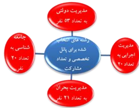
نمودار ۳: رشته‌های مرتبط و موجود در پانل تخصصی و تعداد آنها

برای انجام این پژوهش، ابتدا داده‌های جمع‌آوری شده از مطالعات و تدوین ادبیات تحقیق را در قالب پرسشنامه‌ای با عنوان پرسشنامه «طراحی و تبیین ابعاد محیطی سازمان اداره‌کننده ضربات روحی» که با استفاده از طیف لیکرت پنج گزینه‌ای که از خیلی کم تا خیلی زیاد تنظیم شده بود، تهیه کرده، با عنوان پرسشنامه دور اول دلفی، در اختیار نمونه آماری، مرکب از ۱۱۴ نفر از خبرگان و نخبگان رشته‌های مرتبط با موضوع گذاشته شد. برای تهیه این پرسشنامه، ابتدا الگوهای متغیر-مؤلفه-شاخص‌های به دست آمده از مبانی نظری را جمع‌بندی کرده، در اختیار پانل تخصصی قرار دادیم و با استفاده از روش مصاحبه نیمه‌ساختاریافته، با اعضای پانل در خصوص آنها مصاحبه به عمل آمده و در نهایت پس از تأیید، آنها را وارد پرسشنامه دور اول دلفی نمودیم. هدف محقق از توزیع پرسشنامه دور اول، انتخاب مؤلفه‌های محیطی تأثیرگذار بر سازمان اداره‌کننده ضربات روحی سازمانی و در نهایت، تدوین الگوی مفهومی