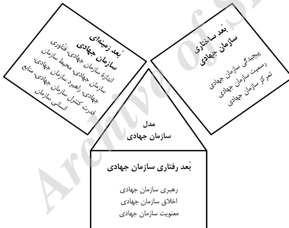
نمودار ۲. مدل سازمان جهادی

با عنایت به پاسخ‌های مذکور که در مصاحبه‌ها به صورت مکرر روی آنها تأکید شده بود، شاخص‌هایی مانند «حمایت از کارکنان از طریق رهبری سازمان»، «ترسیم آینده مطلوب سازمانی از طریق رهبری سازمان»، «تواضع و فروتنی در میان کارکنان»، «ترجیح منافع عمومی توسط مدیران سازمان»، «وجود ارتباطات صمیمی، دوستانه و عاطفی بین مدیران و