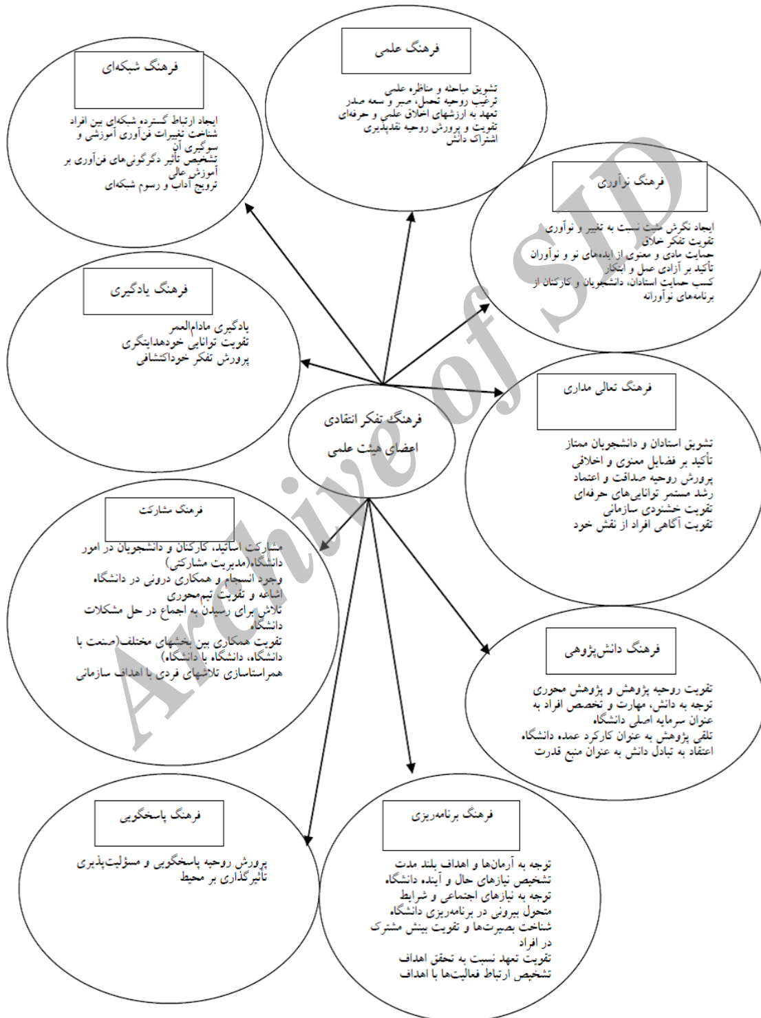
شکل ۲. مدل فرهنگ سازمانی ارتقای تفکر انتقادی

ندارد. مدل فرهنگ سازمانی ارتقای تفکر انتقادی به شرح شکل شماره (۲) می‌باشد.