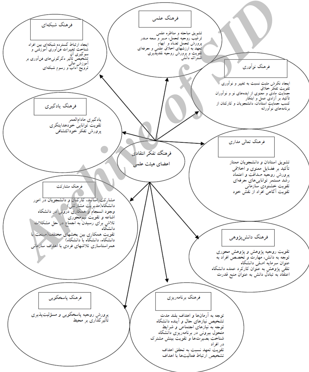
شکل ۱. مدل نهایی فرهنگ سازمانی ارتقاء تفکر انتقادی مستخرج از مبانی نظری تحقیق و نظرات خبرگان

لازم به ذکر است که از خبرگان خواسته شده بود، با دادن امتیازهای ۱ (بسیار کم) تا ۷ (بسیار زیاد) به هر یک از سؤالات این پرسشنامه، نظر خود را ارائه نمایند. در این مرحله تمامی گویه‌های مورد نظر از نظر خبرگان مورد اجماع بود و حول آن پراکندگی وجود نداشت و از آنجایی که دور آخر دلفی در مورد گویه‌های تحقیق به‌شمار می‌رفت، نتایج آزمون